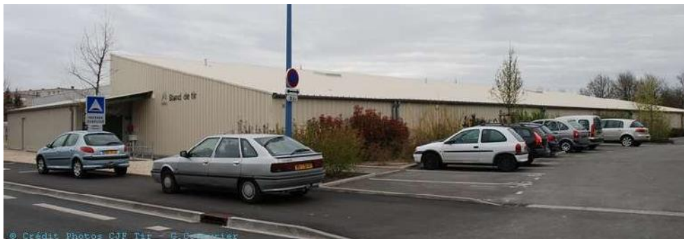
Stand de tir 10m (électro)